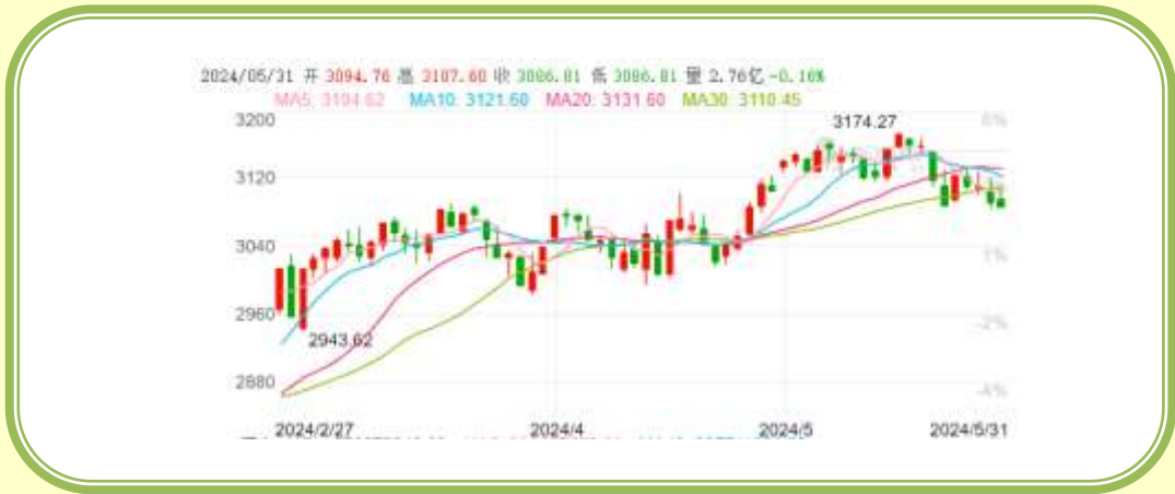
(上证指数 K 线图，截至 5 月 31 日)