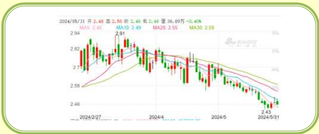
(福田汽车 K 线图，截至 5 月 31 日)