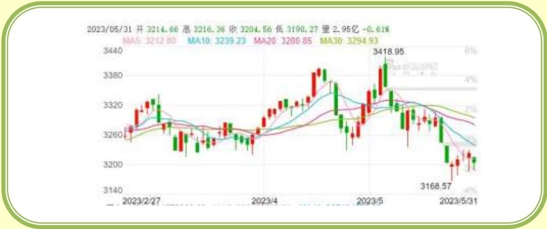
(上证指数 K 线图, 截至 5 月 31 日)