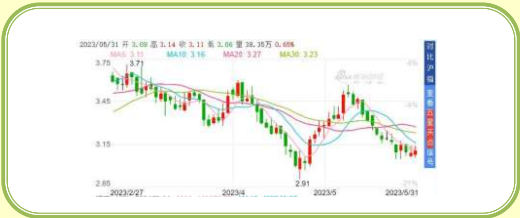
(福田汽车 K 线图, 截至 5 月 31 日)