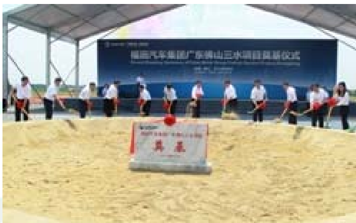
佛山市和三水区的主要领导与福田汽车集团领导共同为项目奠基培土

据悉，福田汽车佛山三水工厂占地933.69亩，项目将一次规划分两期实施，其中一期规划建设年产24万辆生产能力的皮卡和SUV工厂，2015年12月31日前投产，一期工程全部达产后年销售收入360亿元。