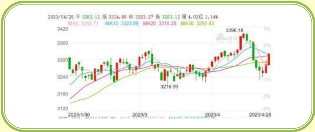
(上证指数 K 线图，截至 4 月 30 日)