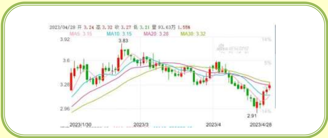
(福田汽车 K 线图，截至 4 月 30 日)