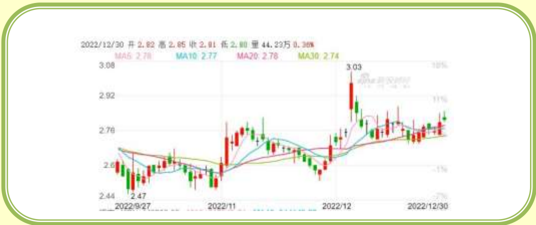
(福田汽车 K 线图，截至 12 月 31 日)