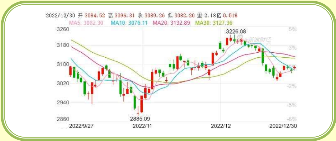
(上证指数 K 线图，截至 12 月 31 日)