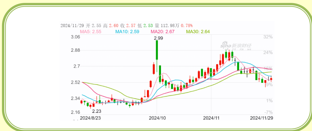
(福田汽车 K 线图, 截至 11 月 30 日)