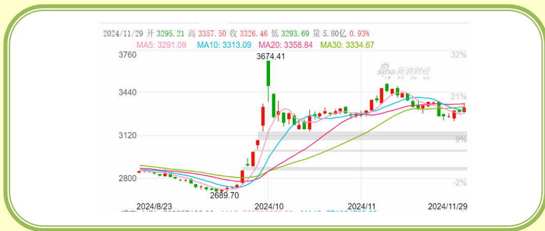
(上证指数 K 线图, 截至 11 月 30 日)