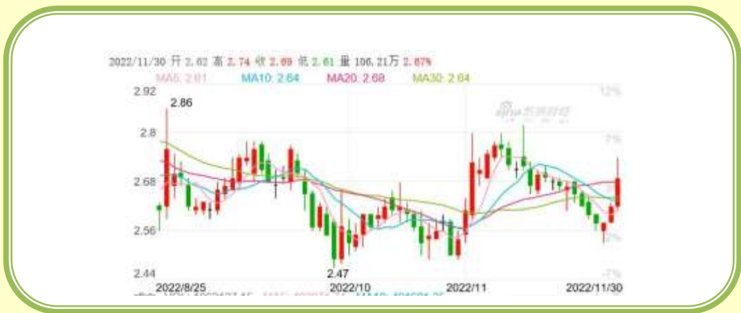
(福田汽车 K 线图，截至 11 月 30 日)