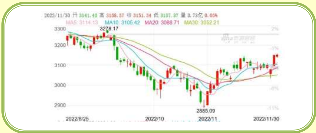
(上证指数 K 线图，截至 11 月 30 日)