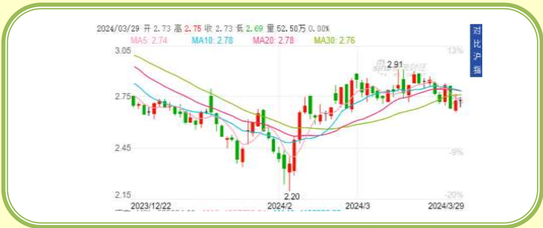
(福田汽车 K 线图，截至 3 月 31 日)