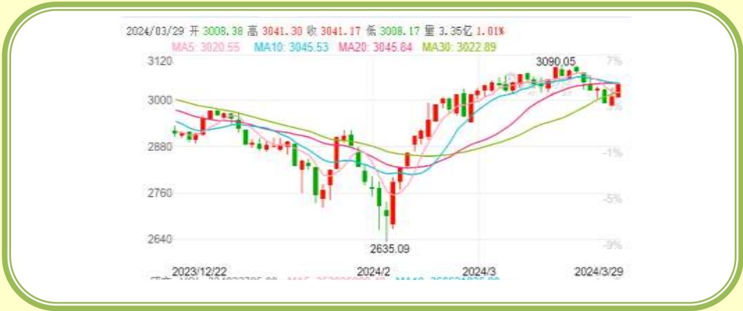
(上证指数 K 线图，截至 3 月 31 日)